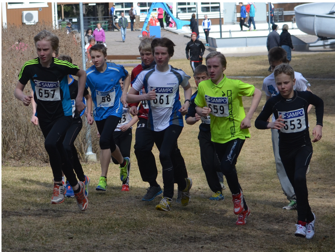
Porin piirimaastojen P14/15-sarjan lähtö. Lisää kuvia Porin maastojuoksuista löytyy SATY:n nettisivuilla.